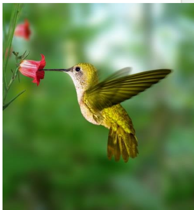
Fig.1.6 Los colibríes requieren mucha energía para volar. Su organismo necesita alimentos ricos en energía, como el néctar de las flores, pues su metabolismo es muy rápido.