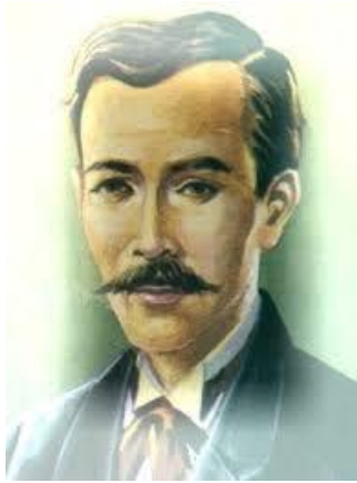
Fig.1.5 (Alfonso L. Herrera, 1868-1942)